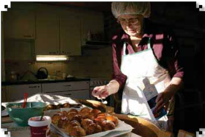
Laskiaissunnuntaina päästiin maistelemaan Elsan makoisia laskiaispullia.