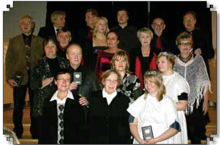
Pikkujouluissa muistettiin ansioituneita karavaanareita.