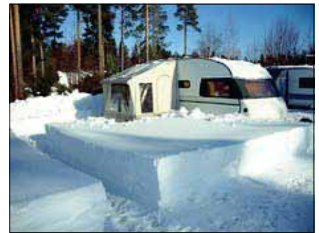
Lumitöitä on riittänyt.

olevat alle 15-vuotiaat lapset osallis- tua kisailuun, vaikka omat vanhem- mat eivät olisikaan SFC:n jäseniä. Hyvä juttu, sieltä niitä uusia jäseniä sitten kasvaa, eikä heille jää tunnetta etteivät he kelpaisi joukkoon mu- kaan.