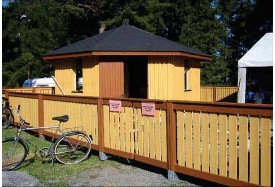
Hyvin sulautuu ympäristöön.