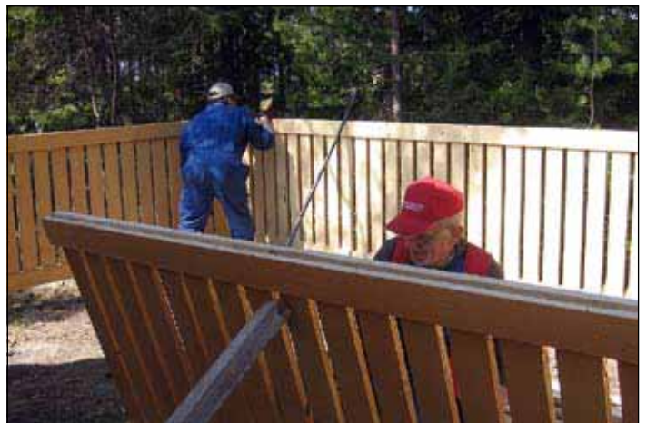
Laki vaatii aidan ja tässä sitä asennetaan.

Kesäkeittiö oli myös työlistalla ja se on sillä mallilla, että alkavalla kesäkaudella siellä voi halutessaan kokkailla ja mikä tärkeintä saadaan tiskiruuhaa puretuksi sesonkikaudella.