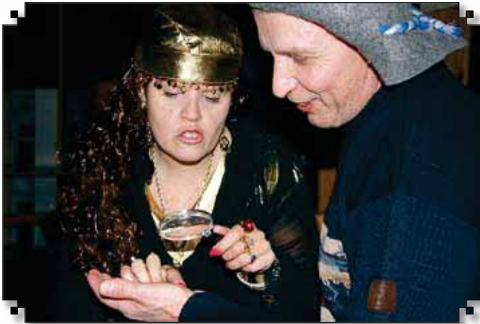
Naamiaisissa ennustajajoukko katsoi lasilla tulevaisuuteen.