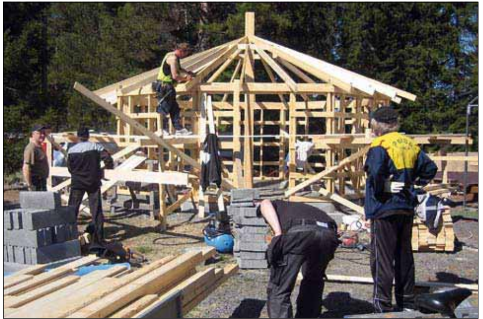
Runkovaiheessa. Onhan se hankalaa kun on kahdeksan kulmaa.

Alkoi jo olla se myyntikojuna toiminut vanha vaunu niin laho ja homeinen, että jotain oli tehtävä. Eikä tainnut ne tilat lukituksineen täyttää lain kirjaintakaan. Itse asiassa syksyllä 2008 oli jo tehty päätös ko. työn aloittamisesta ja rakennuslupakin oli hankittu. Mutta näin vain oli tilanne, Kesäkauden Avajaiset muutaman viikon kuluttua eikä myyntitiloista tietoaakaan.