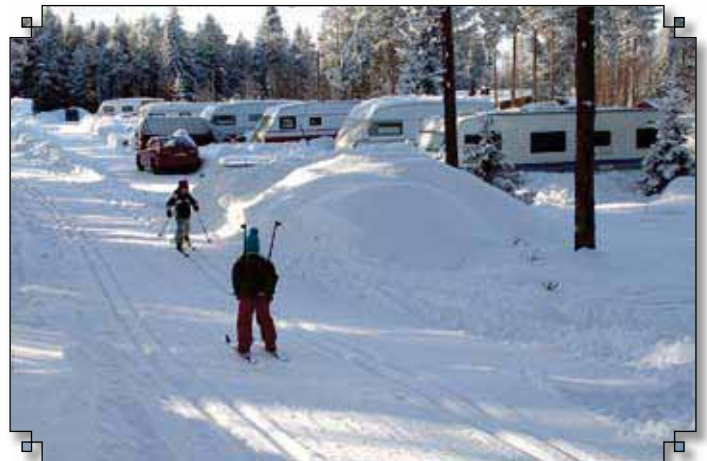
Tyttöjen sukset luistivat joutuisasti kunnan liikuntatoimen höylämällä laduilla.